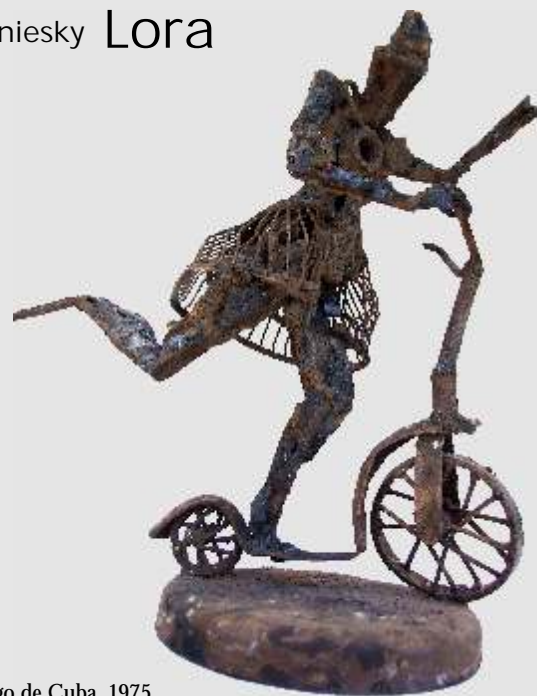
Santiago de Cuba, 1975 Escultor

Estudios realizados 1992 Academia Provincial de Arte José Joaquín Tejada, Santiago de Cuba. 1996 Instituto Superior Pedagógico Frank País García, Santiago de Cuba.